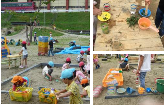
遊びの変化に注目して